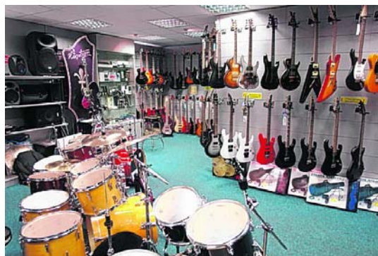
Das Angebot an E-Gitarren bei Reisser ist sehr groß.

er nach Auskunft seines Lehrers heute nicht nur ein vorzüglicher Pianist, er wäre mit Sicherheit auch nicht straffällig geworden.